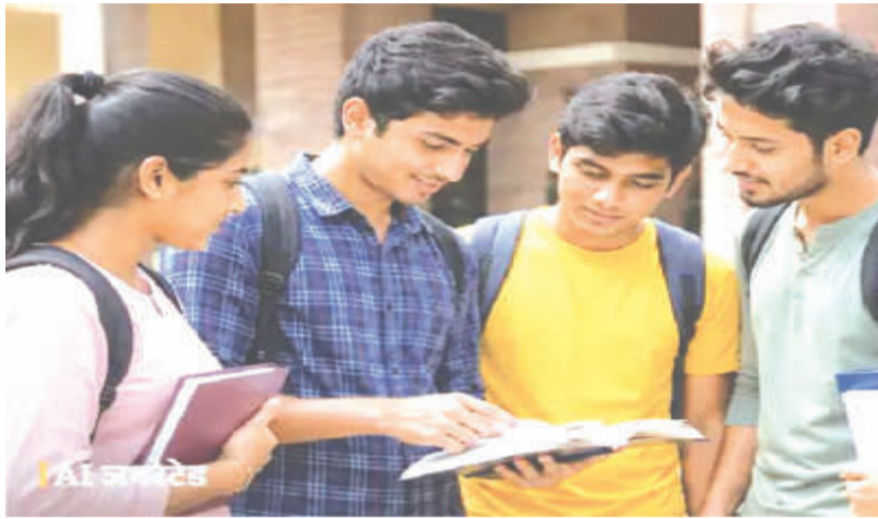
अपने दस्तावेजों का सत्यापन भी कराना होगा। अधूरी मानी जाएगी और वे सीट आवंटन से वंचित बिना सत्यापन के छात्रों को काउंसलिंग प्रक्रिया रह सकते हैं।

ऑनलाइन प्रक्रिया से होगा एडमिशन: शेड्यूल के अनुसार, इस साल प्रवेश प्रक्रिया ऑनलाइन माध्यम से ही पूरी की जाएगी। छात्रों को तय तारीख के भीतर रजिस्ट्रेशन करना होगा और