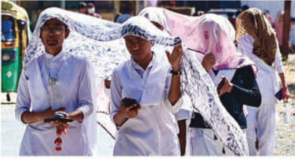
इंदौर ■ निस

इंदौर में रविवार रात हुई बेमौसम बारिश ने शहरवासियों को गर्मी से थोड़ी राहत दी। रात का तापमान 25.2 डिग्री सेल्सियस दर्ज किया गया, जो सामान्य से 2 डिग्री ज्यादा था और रविवार रात के 28.2 डिग्री से तीन डिग्री कम था। शनिवार रात का तापमान सामान्य से पांच डिग्री अधिक 28.2 डिग्री सेल्सियस था। रविवार को दिन में सूरज ने आम उगली, और पारा 43 डिग्री तक पहुंच गया, जो आमतौर पर मई में ही देखा जाता है। शाम के समय अचानक काले बादलों ने शहर को ढक लिया और तेज हवाएं चलने लगीं। शहर के कई इलाकों में बारिश हुई और मौसम सुहाना हो गया। तेज हवाओं की गति 30 किलोमीटर प्रति