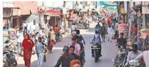
इंदौर ■ निस

चंदननगर से कालानी नगर तक की सड़क को लेकर कई दिनों से चल रही सुनवाई पूरी होने के बाद अब नगर निगम ने पूरे क्षेत्र में अंतिम नोटिस बंटना शुरू कर दिए हैं। इस नोटिस के तहत बाधक निर्माण 15 दिनों में हटाने की मौलत दी जाती है और उसके बाद निगम का अमला क्षेत्र में कार्रवाई करने पहुंचता है। नगर निगम द्वारा चंदननगर से कालानी नगर तक सड़क बनाए जाने को लेकर पिछले दिनों नपती और निशान लगाने की कार्रवाई की गई थी। उसके बाद वहां के रहवासियों ने सड़क की चौड़ाई को लेकर विरोध प्रदर्शन किया था। इसके बाद नगर निगम ने रहवासियों का पक्ष सुनने के लिए तमाम दस्तावेज को लेकर उन्हें झोनलों पर बुलाकर सुनवाई शुरू की थी। इसके बाद से वहां लगातार कई दिनों तक सुनवाई चलती रही, जो अब पूरी हो गई है। नगर निगम के अपर आयुक्त अभय राजनगावकर के मुताबिक चंदननगर की सड़क के मामले को लेकर चल रही सुनवाई पूरी हो गई है और अब अंतिम नोटिस बंटने का काम चल रहा है। अंतिम नोटिस के तहत करीब दो सी से ज्यादा रहवासियों को 15 दिनों में अपने मकान, दुकान के बाधक हिस्से हटाने को कहा गया है। उनका सम्मोचन के बाद निगम द्वारा अपने स्तर पर बाधक निर्माण हटाने की कार्रवाई शुरू की जाएगी।