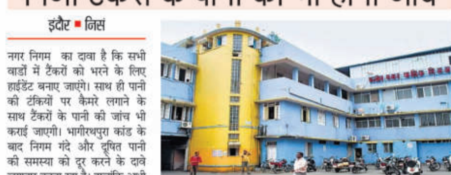
इंदौर