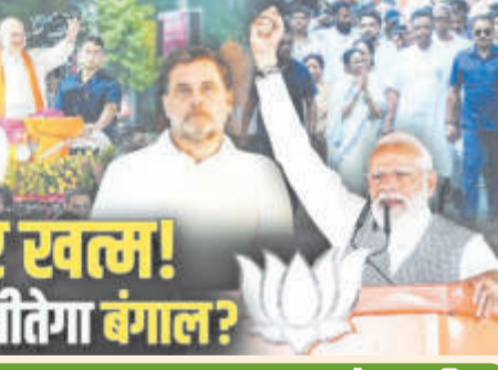
प्रचार स्वत्म! कौन जीतेगा बंगाल?

बांग्लादेश से सटी लंबी तटीय सीमा और सुदूरबन क्षेत्र की संवेदनशीलता को देखते हुए दक्षिण