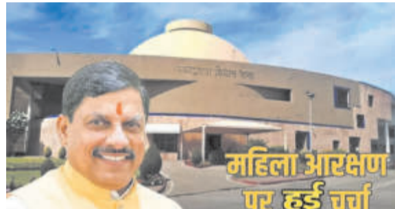
ट्रैक्टर लेकर पहुंचे विधायक को गेट पर रोका, हंगामा

मुख्यमंत्री डॉ. मोहन यादव ने अपने संबोधन की शुरुआत सांस्कृतिक संदर्भों से करते हुए महिला शक्ति के महत्व पर जोर दिया, लेकिन जल्द ही उन्होंने कांग्रेस पर सीधा हमला बोल दिया। उन्होंने कहा कि आजादी के बाद लंबे समय तक सत्ता में रहने के बावजूद कांग्रेस ने महिलाओं के राजनीतिक प्रतिनिधित्व को बढ़ाने