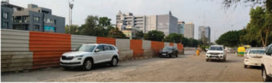
इंदौर ■ निस

अर्जुन बड़ौदा, इलाहाबाद, एमआर-10 और राममंडल में बन रहे प्लायओवर में लगातार लेटलतीपी हो रही है। इसकी वजह से न सिर्फ ट्रैफिक जाम हो रहा है बल्कि हादसे भी बढ़ते जा रहे हैं। इन सभी वजह से जल संसाधन मंत्री तुलसीराम तिलवाट ने अपने निज निवास कार्यालय पर एनएचआई द्वारा संचालित विभिन्न विकास कार्यों की विस्तृत समीक्षा की। इस बैठक में मुख्य रूप से प्लायओवर और अंडरपास के कार्यों को वर्तमान स्थिति पर चर्चा की गई। मंत्री ने निर्माण कार्यों की भीमती गति और बायपास पर लगने वाले लंबे ट्रैफिक जामों के दौरान मंत्री तिलवाट ने बायपास पर लगने वाले लंबे