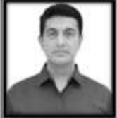
श्रीविवेकतिवारी, फ़िसिक्लॉनवेनेटर, ट्यूमरटेक्नोलॉजी जगद्वैतलिमिटेड

ये डॉक्टरों को शरीर में कहीं भी छिपे कैंसर ट्यूमर को बिना चीरा लगाये अविश्वसनीय सटीकता के साथ हटाने में सहायता करते हैं। ये मशीनें उच्च तीव्रता वाली एक्स-रे या इलेक्ट्रॉन बीम उत्पन्न करती हैं, जिन्हें चिकित्सक ट्यूमर को लक्षित करने और आसपास के स्वस्थ ऊतकों की रक्षा के लिए सटीक रूप से आकार देते और नियंत्रित करते हैं। LINAC –आधारित उपचार विश्व भर में वयस्क कैंसर मामलों के इलाज की सहायक या पैलिएटिव देखभाल का आधार बनता जा रहा है। यह तकनीक इटोसीटी-मॉड्युलेटेड रेडिएशन थेरेपी, वॉल्यूमेट्रिक मॉड्यूलैटेड आर्क थेरेपी और इमेज-गाइडेड रेडिएशन थेरेपी जैसी उन्नत तकनीकों का आधार है। हाल के आंकड़ों के अनुसार, देश भर में केवल लगभग 790 उच्च-वोल्टेज यूनिट्स हैं। एलआईएनएस में 554स्थलों पर लगभग 823 मशीनें काम कर रही थीं, उनमें से लगभग दो-तिहाई जगहों पर केवल एक-एक यूनिट ही चल रही है। हालांकि इस उपचार को सभी लोगों तक पहुंचाना चुनौतीपूर्ण कार्य है।अधिकारश एलआईएनएसी बड़े शहरों और टियर-1 केंद्रों में निजी सेटअप में केंद्रित हैं, जिससे 80%लोगों को देखभाल के लिए दूर जाना पड़ता है।इसका परिणाम देर से होने वाली शुरुआत, मरीजों द्वारा बीच में छोड़ना और अनावश्यक रूप से बीमारी का विनाश है।यह इकाइयों में विशेष गौरवों या छोटे इलाकों को सबसे अधिक प्रभावित करती हैं जो लंबी यात्राओं, आवास आदि का खर्च नहीं उठा सकते। लेकिन अब भारत का 'मेक इन इंडिया' अभियान इस अंतर को पाटने के लिए स्थानीय एलआईएनएस प्रोडक्ट