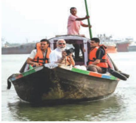
कोलकाता। पीएम मोदी ने हुगली नदी में नाव की सवारी की: नाव चलाने वाले को गले लगाया, रु. 1000 दिए 15 दिन पहले झालमुड़ी खाई थी।