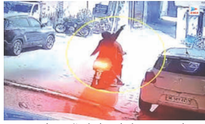
युवक का नाम लेकर फायरिंग की गई थी। उसका एक बदमाश से कुछ दिनों से विवाद चल रहा था, वारदात से कुछ देर पहले ही वह बदमाश और युवक श्यामलाहिल्स थाने से समझौता करके निकले थे। पीड़ित युवक ने उसी बदमाश

शहर के श्यामलाहिल्स थाना इलाके में बुधवार देर रात बिना नंबर की बाइक से आये अज्ञात नकाबपोश बदमाशों ने एक युवक के घर के बाहर हवाई फायरिंग कर दहशत फैलाते हुए फरार हो गये। बताया गया है कि बदमाशों ने पहले युवक के घर जाकर उसका नाम लेकर चिल्लाचोट की और कुछ देर बाद दो राउंड हवाई फायरिंग कर भाग गये। जिस