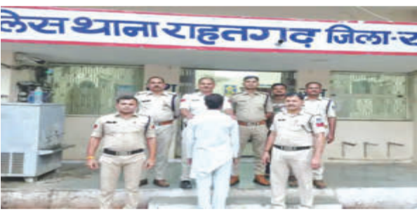
केस थाना राहतगढ़ जिला-क