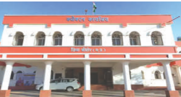
ऑथेंटिकेशन से होगी प्रक्रिया: हितग्राहियों की इकेवाईसी पीओएस मशीन और फंस ऑथेंटिकेशन तकनीक के माध्यम से की जाएगी। इससे पहचान प्रक्रिया अधिक पारदर्शी और सटीक बनेगी। विभाग और फंस ऑथेंटिकेशन और संबंधित अधिकारियों को इस कार्य

निर्देश दिए गए हैं। 2021 से पहले इकेवाईसी कराने वालों को फिर करना होगा सत्यापन: खाद्य विभाग के अनुसार जिले में ऐसे 50,146 हितग्राही चिन्हित किए गए हैं, जिनकी इकेवाईसी पांच वर्षों या उससे अधिक समय पहले हुई थी। शासन के निर्देशों के तहत अब इन सभी हितग्राहियों का पुनः सत्यापन किया जाएगा, ताकि पात्र और अपात्र हितग्राहियों की सही पहचान सुनिश्चित हो सके। पीओएस मशीन और फंस