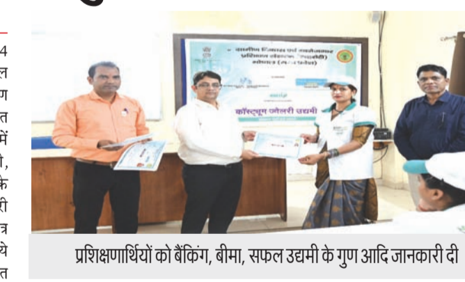
प्रशिक्षार्थियों को बैकिंग, बीमा, सफल उद्यमी के गुण आदि जानकारी दी