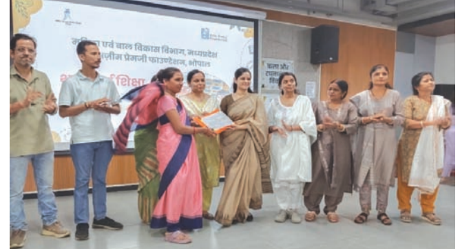
संयुक्त तत्वावधान में किया गया। सेमिनार में सात सेक्टरों से आई 175 से अधिक आंगनवाड़ी कार्यकर्ता, सुपरवाइजर, सीडीपीओ, महिला एवं बाल विकास विभाग के अधिकारी एवं अजीम प्रेमजी फाउण्डेशन से जुड़े जानकार शामिल हुए। सेमिनार में 14 आंगनवाड़ी कार्यकर्ताओं की प्रस्तुतियां केंद्र में रहीं, जिनमें उन्होंने खेल, गतिविधियों और स्थानीय शिक्षण-अधिगम सामग्री के माध्यम से बच्चों में भाषा, संज्ञानात्मक, सामाजिक और गणितीय समझ को प्रस्तुत किया गया। प्रस्तुतियों में यह भी सामने आया कि नियमित अवलोकन, बच्चों की रुचियों को समझने और समुदाय की भागीदारी बढ़ाने से आंगनवाड़ी केंद्रों को सीखने का वातावरण अधिक समृद्ध हुआ है।

शाला पूर्व शिक्षा को बच्चों के लिए अधिक आनंददायक, प्रभावी और सीख-केंद्रित बनाने की दिशा में आंगनवाड़ी कार्यकर्ताओं द्वारा किए जा रहे नवाचारों और प्रयासों को साझा करने के लिए अजीम प्रेमजी यूनिवर्सिटी सभागार में ईसीई सेमिनार आयोजित किया गया। फंडा परियोजना के अंतर्गत आयोजित इस सेमिनार में आंगनवाड़ी कार्यकर्ताओं ने अपने केंद्रों पर किए गए प्रयोगों, बच्चों के साथ हुए सीखने के अनुभवों और स्थानीय संसाधनों के उपयोग से विकसित शिक्षण पद्धतियों को प्रस्तुत किया। इस सेमिनार का आयोजन फंडा परियोजना एवं अजीम प्रेमजी फाउण्डेशन के संयुक्त तत्वावधान में किया गया।