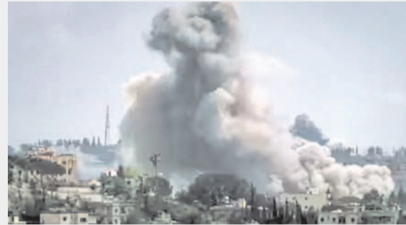
तेहरान/वाशिंगटन/ कुवैत सिटी/ मनामा। एजेंसी।