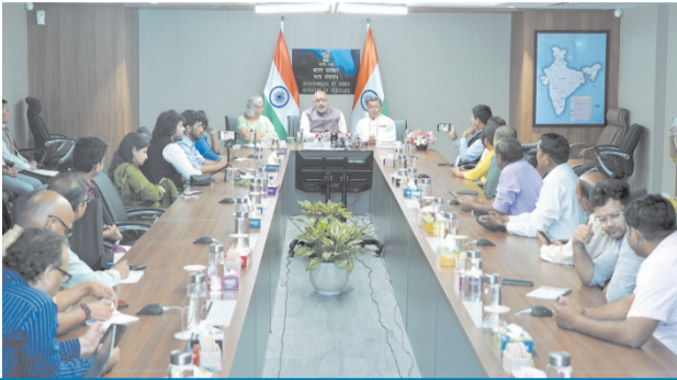
वस्त्र मिशन के तहत देश में अभिनव परियोजनाएं शुरू की

नई दिल्ली। एजेंसी। केंद्रीय वस्त्र मंत्री गिरिराज सिंह ने गुरुवार को पिछले 12 वर्षों में वस्त्र मंत्रालय की उपलब्धियों पर प्रकाश डालते हुए कहा कि प्रधानमंत्री नरेन्द्र मोदी के दूरदर्शी नेतृत्व में वस्त्र और परिधान क्षेत्र में अगले 3 वर्षों में लगभग 2 करोड़ अतिरिक्त रोजगार सृजित करने की उम्मीद है।