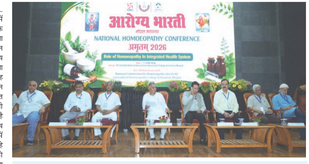
500 से अधिक विद्यार्थी, शिक्षक, शोधार्थी एवं प्राध्यापक उपस्थित थे