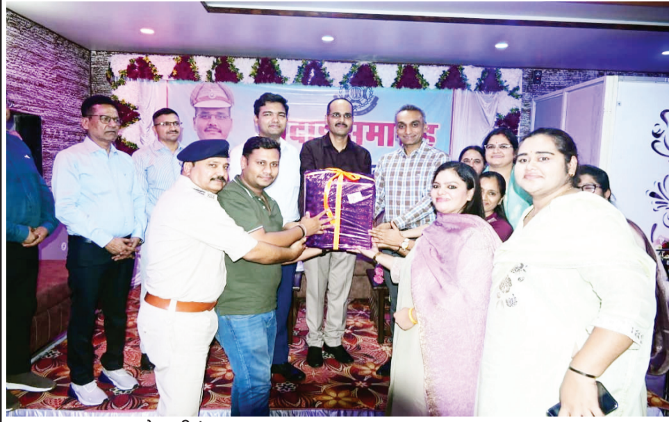
रायसेन ■ विलें

वैतल स्थानांतरण होने पर अतिरिक्त पुलिस अधीक्षक