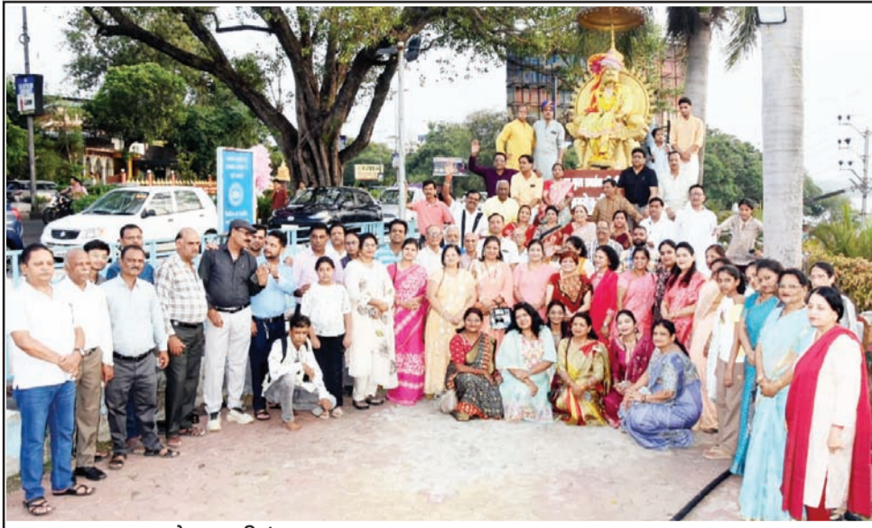
भोपाल ■ निखिल अग्रवाल समाज द्वारा अपने आराध्य देव महाराजा अग्रसेन एवं कुलदेवी माता महालक्ष्मी की 27वीं महाआरती रविवार सायंकाल श्री अग्रसेन वाटिका, आईटीसी पार्क, कमला पार्क के सामने, भोपाल में ब्रह्म एवं भक्ति भाव के साथ सम्पन्न हुई। महाआरती में