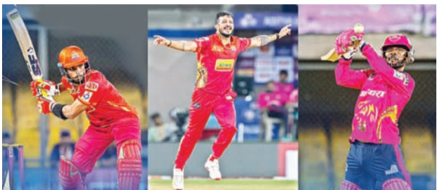
रनों की मैच जिगडॉ परी खेली।

स्थानीय होल्कर स्टेडियम में खेले जा रहे मध्य प्रदेश प्रीमियर लीग (एमपीएल-2026) के सातवें मुकाबले में शुक्रवार को जबलपुर रायल लायंस ने एकतरफा प्रदर्शन करते हुए इंदौर पिंक पैथर्स को 5 विकेट से करारी शिकस्त दी। इस टूर्नामेंट में इंदौर की यह लगातार दूसरी हार है, जिससे टीम की आगे की राह अब कठिन हो गई है। इंदौर द्वारा दिए गए 149 रनों के चुनौतीपूर्ण लक्ष्य को जबलपुर ने मात्र 18 ओवरों में 5 विकेट खोकर आसानी से हासिल कर लिया। जबलपुर की इस घमाकेदार जीत के सामने इंदौर के गेंदबाजी रणनीति पूरी तरह असहाय और नाकाम नजर आई।