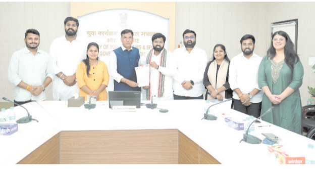
विकसित करने की मांग, प्रत्येक राज्य में खेल विश्वविद्यालयों की स्थापना और हर जिले में खेल उकृष्टता केंद्र व मल्टी-स्पोर्ट