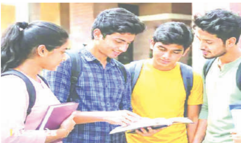
अपने दस्तावेजों का सत्यापन भी कराना होगा। अधूरी मानी जाएगी और वे सीट आवंटन से वंचित रह सकते हैं।

एमपी के सरकारी और निजी कॉलेजों में स्नातक (यूजी) और स्नातकोत्तर (पीजी) पाठ्यक्रमों में प्रवेश के लिए उच्च शिक्षा विभाग ने काउंसिलिंग का शेड्यूल जारी कर दिया है। यूजी के लिए 1 मई और पीजी के लिए 2 मई से ऑनलाइन रजिस्ट्रेशन के साथ दस्तावेज सत्यापन अनिवार्य रहेगा। इस बार विभाग ने दो मुख्य काउंसिलिंग राउंड के साथ कॉलेज लेवल काउंसिलिंग का एक अतिरिक्त राउंड भी जोड़ा है। कॉलेज में एडमिशन लेने वाली छात्राओं को लाडली लक्ष्मी योजना से 25000 रुपये की सहायता दी जाएगी।