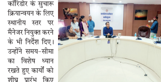
कॉरिडोर के सुचारु क्रियान्वयन के लिए स्थानीय स्तर पर मैनजर नियुक्त करने के भी निर्देश दिए। उन्होंने समय-सीमा का विशेष ध्यान रखते हुए कार्यों की शीघ्र प्रगति किए जाने हेतु निर्देशित किया। उन्होंने कहा कि आवश्यकता के अनुसार श्रमिकों की संख्या भी बढ़ाई जाए। कलेक्टर ने स्पष्ट किया कि निर्माण कार्यों में तकनीकी मानकों एवं गुणवत्ता से किसी प्रकार का समझौता नहीं किया जाएगा। इस संबंध में उन्होंने सौम्यता से नगर पालिका को निर्देश दिए कि कार्यों की गुणवत्ता का समय-समय पर निरीक्षण किया जाए और नियमित मॉनिटरिंग सुनिश्चित की जाए।

नर्मदापुरम ■ अमृत दर्शन कलेक्टर ने रेवा सभा कक्ष में आयोजित बैठक के दौरान नर्मदालोक कॉरिडोर के अंतर्गत संचालित निर्माण कार्यों की समीक्षा बैठक के दौरान संबंधित अधिकारियों एवं निर्माण एजेंसी को कार्यों में तेजी लाने के निर्देश दिए। उन्होंने निर्माण कार्य हेतु निर्माण एजेंसी के लिए विस्तृत वर्क शेड्यूल तैयार करने के निर्देश दिए। कलेक्टर ने सौम्यता से नगर पालिका नर्मदापुरम को निर्देशित किया कि वर्क शेड्यूल के कार्यों को साप्ताहिक लक्ष्यों में विभाजित किया जाए तथा प्रत्येक सप्ताह कार्य प्रगति की रिपोर्ट प्रस्तुत की जाए। उन्होंने निर्माण एजेंसी के प्रतिनिधियों को निर्देश दिए कि यथाशीघ्र पूरी टीम को मोबाइलाइज कर कार्य में तेजी लाई जाए। बैठक में कलेक्टर ने नर्मदालोक