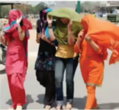
मालवा और निमाड अंचल में अप्रैल में ही हीटवेव जैसे हालात पारा 43°C पार, राहत के आसार नहीं

में 42.0, खंडवा और उज्जैन में 41.5 डिग्री सेल्सियस तापमान रिकॉर्ड किया गया। इंदौर में भी पारा 41.2 डिग्री तक पहुंच गया है।