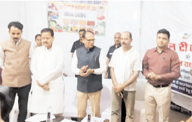
भी कहा कि मानसून की बारिश शुरू होने से पहले ही पूरे खरीदी प्रक्रिया संपन्न कर ली जाएगी। इसके लिए अधिकारियों को खरीदी केंद्रों पर बेहतर इंतजाम सुनिश्चित करने के निर्देश दिए गए हैं।

रायसेन। केंद्रीय कृषि मंत्री शिवराज सिंह चौहान शनिवार शाम 6:30 बजे रायसेन पहुंचे। उन्होंने जिला कलेक्टर के विदेश-रायसेन संसदीय क्षेत्र को गेहूं उपार्जन व्यवस्थाओं की विस्तृत समीक्षा की। बैठक के दौरान, उन्होंने अधिकारियों को स्पष्ट निर्देश दिए कि खरीद प्रक्रिया में किसानों को किसी भी तरह की परेशानी नहीं होनी चाहिए और सभी व्यवस्थाएं सुचारु रूप से संचालित हों। बाद में, उन्होंने पत्रकारों की भी चर्चा की। मंत्री चौहान ने बताया कि इस वर्ष प्रदेश में गेहूं का बंपर उत्पादन हुआ है और सरकार किसानों का एक-एक दाना खरीदेगी। उन्होंने स्लॉट बुकिंग में आ रही तकनीकी समस्याओं को जल्द दूर करने का आश्वासन दिया, ताकि किसानों को किसी प्रकार की असुविधा न हो। उन्होंने यह