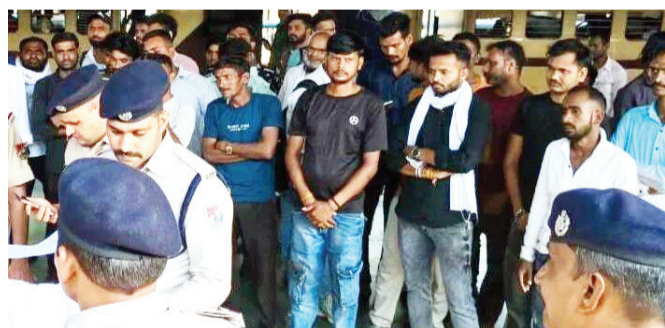
पर कुल 66,000 रुपये का आर्थिक दंड लगाया। इटारसी जैसे महत्वपूर्ण जंक्शन पर इतनी बड़ी संख्या में वेंडरों का पकड़ा जाना इस बात का स्पष्ट संकेत है कि यहां अवैध वेंडिंग का जाल काफी गहरा फैला हुआ है। आरपीएफ की इस निरंतर कार्रवाई ने अवैध वेंडिंग के गोरखबंधों की कमर तोड़ दी है।

इटारसी ■ अमृत दर्शन रेलवे स्टेशनों और ट्रेनों में यात्रियों की सुरक्षा और सुविधा से खिलवाड़ करने वाले तत्वों के विरुद्ध रेलवे सुरक्षा बल इटारसी ने कार्रवाई को अंजाम दिया है। आरपीएफ भोपाल के वरिष्ठ मंडल सुरक्षा आयुक्त डॉ. अभिषेक के निर्देशन में चलाए गए इस विशेष अभियान ने स्टेशन पर हड़कंप मचा दिया है। एक ही दिन में 70 गिरफ्तार, 66 हजार का जुर्माना: आरपीएफ इटारसी ने स्टेशन परिसर, आउटर और ट्रेनों में सघन चेकिंग अभियान चलाया। इस दौरान विभिन्न रेल अधिनियमों का उल्लंघन करने वाले कुल 70 व्यक्तियों को रोकें हथौड़े दबोचा गया। इन सभी आरोपियों को भोपाल स्थित माननीय रेलवे मजिस्ट्रेट के समक्ष पेश किया गया, जहां कोर्ट ने सख्त रकब अर्थात् 66 हजार रुपये के आर्थिक दंड लगाया। इटारसी जैसे महत्वपूर्ण जंक्शन पर इतनी बड़ी संख्या में वेंडरों का पकड़ा जाना इस बात का स्पष्ट संकेत है कि यहां अवैध वेंडिंग का जाल काफी गहरा फैला हुआ है। आरपीएफ की इस निरंतर कार्रवाई ने अवैध वेंडिंग के गोरखबंधों की कमर तोड़ दी है।