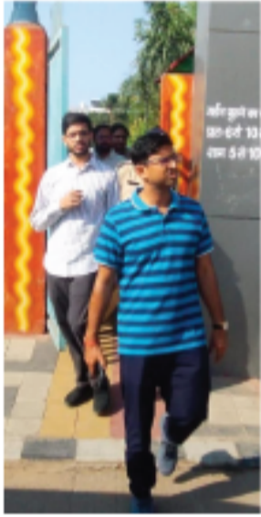
आयुक्त विधित्त सिंघल द्वारा आन प्रातःकाल नगर निगम के जून क्रमांक 07 अंतर्गत विभिन्न क्षेत्रों का...