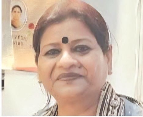
महिलाओं की भूमिका को और मजबूत करेगा। जिला प्रशासन, विशेषकर कलेक्टर और एसपी सहित समूची टीम ने परियोजना को पूर्ण समर्थन दिया है। सामाजिक

स्थलों के प्रति जागरूकता भी बढ़ी है। महिला फेडरेशन का गठन इस परियोजना की सबसे मजबूत कड़ी है। इस फेडरेशन के माध्यम से योजना को सस्टेनेबल बनाया जा रहा है, ताकि महिलाएँ स्वयं इसे आगे चलाएँ और आने वाली पीढ़ियों को भी लाभ मिलता रहे। फेडरेशन की सक्रिय सदस्याएँ अब पर्यटन सखी के रूप में कार्य कर रही हैं, जिससे स्थानीय महिलाओं को रोजगार के पर्याप्त अवसर मिल रहे हैं। पर्यटन सुविधाओं में नई शुरुआत: अब परियोजना के अगले चरण में टूरिस्ट फॅसिलिटी सेंटर खोला जा रहा है। इस केंद्र के माध्यम से बुरहानपुर आने वाले पर्यटकों को एक ही छत के नीचे सभी सुविधाएँ उपलब्ध होंगी - स्थानीय परिवहन, गाइड, होटल/होमस्टे बुकिंग, स्मारक/स्मारकों की जानकारी, स्वास्थ्य सुविधाएँ आदि। यह केंद्र पूरी तरह महिला सखियों और महिला फेडरेशन द्वारा संचालित होगा, जो