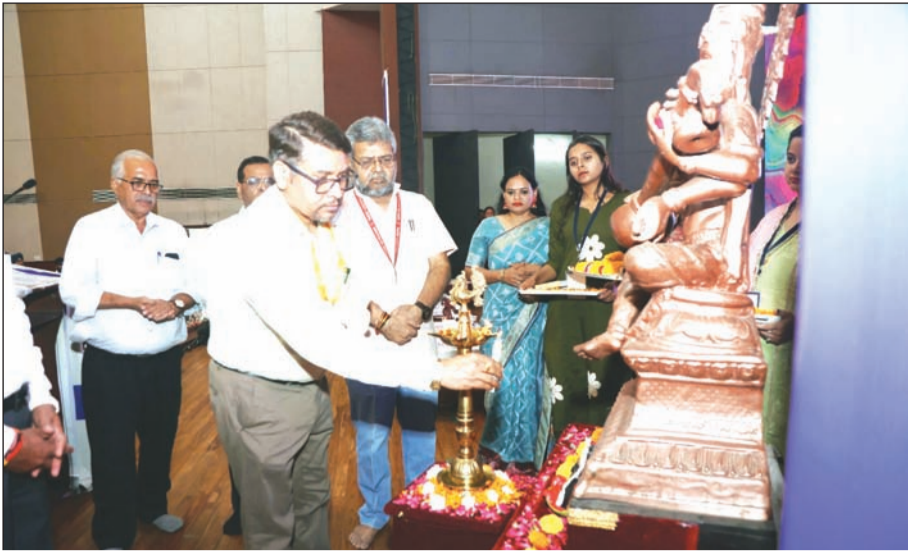
दिव्यांगता पुनर्वास पर कार्यक्रम सम्पन्न