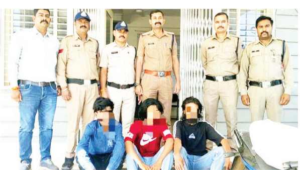
संपत्ति जब्त की है। वहीं थाना विछिया पुलिस ने 06 आरोपियों को गिरफ्तार कर 28.930 किलोग्राम अवैध गांजा (कीमत 4 लाख 20 हजार), परिवहन में प्रयुक्त कार (20 लाख रुपए), 08 मोबाइल (80 हजार रुपए) एवं नगर 73 हजार 50 रुपए जब्त किए हैं। इस प्रकार दोनों कार्यवाही में पुलिस ने लगभग 34 लाख 23 हजार 599 रुपए की संपत्ति जब्त की है। राजगढ़: जीरापुर पुलिस ने 'ओपरेशन शुद्धि' के तहत 298 ग्राम स्मैक एवं 5.496 किलोग्राम कैमिकल पाउडर (टांका) जब्त कर लगभग 35 लाख रुपए की संपत्ति जब्त की है। नीमच: थाना नीमच पुलिस ने 150 ग्राम एमडी (कीमत 15 लाख रुपए) एवं 06 किलोग्राम पीसा हुआ डोडचुरा (कीमत 90 हजार रुपए) जब्त कर 03

भोपाल। मध्यप्रदेश पुलिस द्वारा प्रदेशभर में अवैध मादक पदार्थों की तस्करी, भंडारण एवं बिक्री के विरुद्ध लगातार कार्यवाहियों की जा रही हैं। इसी कार्यवाही के दौरान पुलिस टीमों ने विगत 07 दिनों में विभिन्न जिलों में अवैध मादक पदार्थों के विरुद्ध प्रभावी कार्यवाही करते हुए 1 करोड़ 38 लाख रुपए से अधिक के मादक पदार्थ, वाहन, नकदी एवं अन्य सामग्री जब्त की हैं। कई अंतर्राज्यीय तस्करी को गिरफ्तार कर एनडीपीए एक्ट के तहत वैधानिक कार्यवाही भी की गई। रोवा: थाना सिविल लाइन पुलिस ने 749 सौरी कोडीन युक्त कफ़ सिरप (कीमत 1 लाख 50 हजार 549 रुपए) तथा तस्करी में प्रयुक्त बलेनो वाहन (कीमत लगभग 7 लाख रुपए) सहित लगभग 8 लाख 50 हजार 549 रुपए की