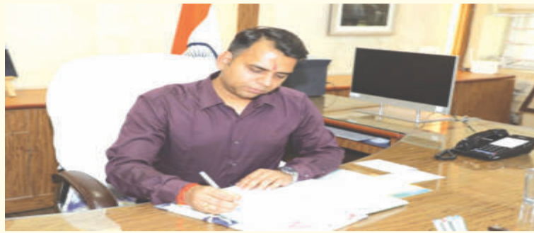
उक्त आदेश अनुसार समस्त शासकीय संस्था प्रमुख / शिक्षक प्रातः 07:30 बजे से दोपहर 1:30 बजे तक विद्यालय में उपस्थित रहकर विभागीय शासकीय कार्य संपादित करेंगे। शासन द्वारा पूर्व से निर्धारित परीक्षाएँ एवं अन्य शासकीय कार्य यथावत पूर्व निर्देशानुसार संचालित होंगे।