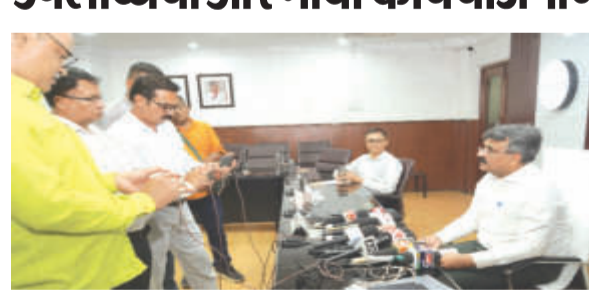
जबलपुर ■ हिंस

साझा की पश्चिम मध्य रेल की उपलब्धियां और भावी कार्ययोजनाओं