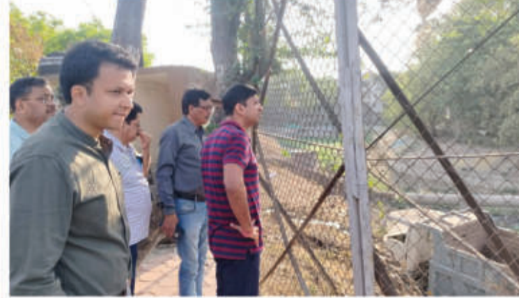
इंदौर •