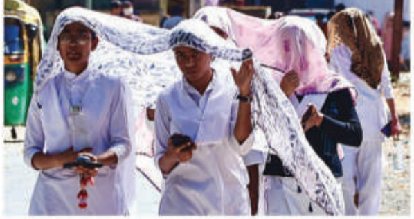
इंदौर • निस

इंदौर में रविवार रात हुई बेमौसम बारिश ने शहरवासियों को गर्मी से थोड़ी राहत दी। रात का तापमान 25.2 डिग्री सेल्सियस दर्ज किया गया, जो सामान्य से 2 डिग्री ज्यादा था और शनिवार रात के 28.2 डिग्री से तीन डिग्री कम था। शनिवार रात का तापमान सामान्य से पांच डिग्री अधिक 28.2 डिग्री सेल्सियस था। रविवार को दिन में सूरज ने आग उगली, और पारा 43 डिग्री तक पहुँच गया, जो आमदौर पर मई में ही देखा जाता है। शाम के समय आचानक काले बादलों ने शहर को ढक लिया और तेज हवाएँ चलने लगीं। शहर के कई इलाकों में बारिश हुई और मौसम सुहाना हो गया। तेज हवाओं की गति 30 किलोमीटर प्रति