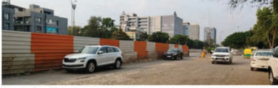
इंदौर • निस

अजुन बड़ौदा, झलारिया, एमआर-10 और राममंडल में बन रहे फ्लायओवर में लगातार लेटलैतीनी हो रही है। इसकी वजह से न सिर्फ ट्रैफिक जाम हो रहा है बल्कि हादसे भी बढ़ते जा रहे हैं। इन सभी वजह से जल संसाधन मंत्री तुलसीराम सिलवाल ने अपने निजी निवास कार्यालय पर एनएचआई द्वारा संचालित विभिन्न विकास कार्यों की विस्तृत समीक्षा की। इस बैठक में मुख्य रूप से फ्लायओवर और अंडरपास के कार्यों की वर्तमान स्थिति पर चर्चा की गई। मंत्री ने निर्माण कार्यों की भीमती गति और बायपास पर लगने वाले लंबे ट्रैफिक जाम को लेकर सख्त रुख अपनाया। समीक्षा के दौरान मंत्री सिलवाल ने बायपास पर लगने वाले लंबे