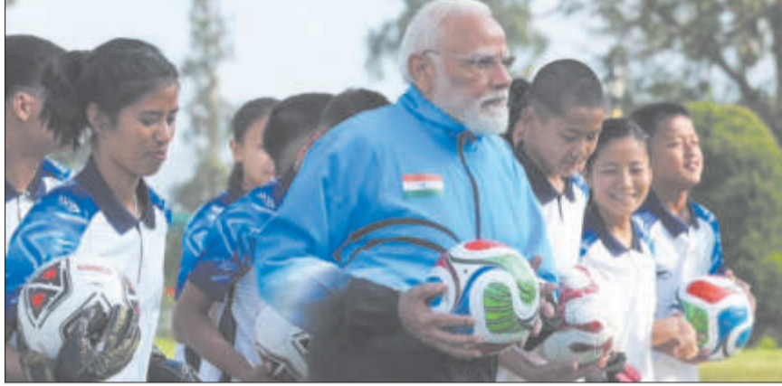
सिक्किम राज्य के 50वें स्थापना दिवस समारोह के समापन कार्यक्रम में शामिल हुए। राज्य के

सिक्किम के दो दिन के दौरे पर पहुंचे पीएम नरेंद्र मोदी ने मंगलवार सुबह गंगटोक में बच्चों के साथ फुटबॉल खेले। पीएम ने सोशल मीडिया पर फुटबॉल खेलते हुए तस्वीरें शेयर की। 'पीएम ने एक्स पर लिखा, 'इन बच्चों के साथ फुटबॉल खेलकर ऊर्जा से भर गया।' आज मोदी