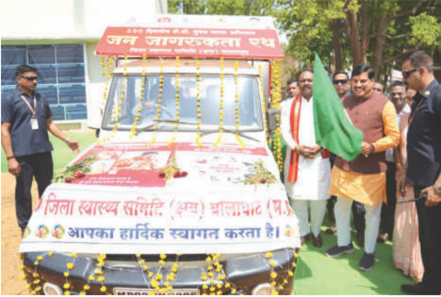
भोपाल। मुख्यमंत्री डॉ. मोहन यादव ने बालाघाट में 100 दिवसीय टीबी (क्षय रोग) रोग मुक्त अभियान के जन जागरूकता रथ को हरी झंडी दिखाई।