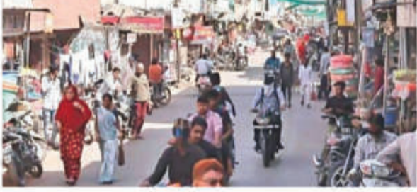
इंदौर • निस

चंदननगर से कालानी नगर तक की सड़क को लेकर कई दिनों से चल रही सुनवाई पूरी होने के बाद अब नगर निगम ने पूरे क्षेत्र में अंतिम नोटिस बंटना शुरू कर दिए हैं। इस नोटिस के तहत बाधक निर्माण 15 दिनों में हटाने की मोहलत दी जाती है और उसके बाद नगर निगम का अमला क्षेत्र में कार्रवाई करने पहुंचता है। नगर निगम द्वारा चंदननगर से कालानी नगर तक सड़क बनाए जाने को लेकर पिछले दिनों नपती और निशान लगाने की कार्रवाई की गई थी। उसके बाद वहां के रहवासियों ने सड़क को चौड़ाई को लेकर विरोध प्रदर्शन किया था। इसके बाद नगर निगम ने रहवासियों का