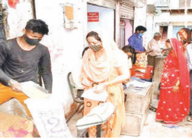
आर्थिक संकट से जूझ रही महिलाएं

मप में 1200 करोड़ रुपए की टेक होम राशन व्यवस्था पर आर्थिक संकट मंडरा रहा है। महिलाओं को आत्मनिर्भर बनाने के उद्देश्य ने सरकार ने प्रदेश में पोषण आहार प्लांट चलाने की जिम्मेदारी महिलाओं का दी थी। लेकिन निरंतर घाटे के कारण पोषण आहार प्लांट पर आर्थिक संकट इस कदर मंडराया है कि ये करीब तीन महीने से बंद पड़े हैं। सरकार का कहना है कि समूहों द्वारा संचालित सातों प्लांट सालाना 40-50 करोड़ रुपए का नुकसान उठ रहे हैं और पिछले 4 वर्षों में कुल घाटा 300 करोड़ रुपए तक पहुंच गया है। यह भी तर्क दिया जा रहा है कि मौजूदा प्लांट समय पर सप्लाई नहीं कर पा रहे हैं, जिससे हितग्राहियों तक राशन पहुंचने में दे-दो महीने की देरी हो रही है। इसका असर सह हुआ है कि इसमें काम करने वाले महिलाएं अब मजबूरी करने को मजबूर हैं।