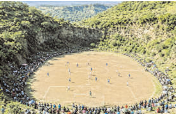
टेपेटालपा कस्बे की एक लोकल लीग के मैच खेला जाता है। मीडिया रिपोर्टों के मुताबिक इस मैदान पर टेओका

दुनिया भर में बड़े-बड़े फुटबाल स्टेडियमों पर अरबों रुपए खर्च किए जाते हैं, जहां पर फिफा से जुड़े मैच के अलावा क्लबों के मैच भी खेलते जाते हैं, लेकिन मेक्सिको का एक साधारण सा मिट्टी का मैदान दुनिया को हैरान कर रहा है। मेक्सिको सिटी के दक्षिण में एक बुझे हुए ज्वालामुखी के खोखले हिस्से के टीक बीचों-बीच फुटबाल मैदान है, जिसे फोल्ड आफ द गार्ड्स यानी देवताओं का मैदान कहा जाता है। हरी-भरी झाड़ियों और पहाड़ों से घिरा यह मैदान हर रविवार को गुलजार होता है, जब यहां सांता सेसिलिया