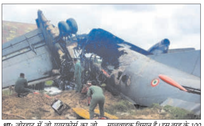
थार: जोरहाट में जो एयरफोर्स का जो मालवाहक विमान है। इस तरह के 100 विमान क्रैश हुआ है। वह AN-32 विमान भारतीय वायुसेना के बेड़े में शामिल हैं। इसे सेना में बेहतर ट्रांसपोर्ट भारतीय वायुसेना के ट्रांसपोर्ट क्षमताओं को लगातार बढ़ा रहा है। जो गर्म मौसम के हिसाब से डिजाइन किया गया है। यह

असम के जोरहाट एयर फोर्स स्टेशन पर भारतीय वायु सेना का (IAF) का एयरक्राफ्ट क्रैश हुआ है। क्रैश होते ही विमान में आग लग गई। विमान दो हिस्सों में टूट गया और दूर से ही इसका धुआँ दिख रहा है। राहत और बचाव दल की टोमों मौके पर पहुंच गई हैं। शुरुआती रिपोर्ट के मुताबिक AN-32 एयरक्राफ्ट एयर फोर्स जोरहाट स्टेशन के अंदर ही गिरा है। गिरते ही उसमें तेज आग लग गई थी। इमरजेंसी रिस्पॉन्स टोमों मौके पर काम में जुटी हैं।