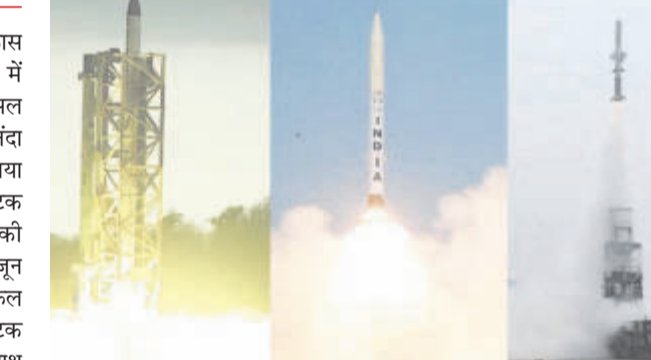
रक्षा मंत्री ने दी बधाई

भारतीय रक्षा अनुसंधान और विकास संगठन (डीआरडीओ) ने रक्षा क्षेत्र में एक बहुत बड़ा मौल का पत्थर हासिल किया है। भारत अब दुनिया के उन चुनिंदा देशों के 'एलीट क्लब' में शामिल हो गया है। जिनके पास लंबी दूरी के बैलिस्टिक मिसाइल हमलों से बचाव करने की अचूक क्षमता है। भारत ने 10 और 11 जून को लगातार तीन मिसाइलों के सफल उड़ान परीक्षण किए, जिनमें बैलिस्टिक मिसाइल डिफेंस (BMD) के साथ-साथ एंटी-शिप मिसाइल टेक्नोलॉजी भी शामिल है।