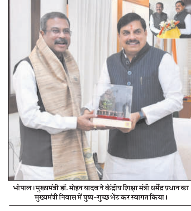
भोपाल। मुख्यमंत्री डॉ. मोहन यादव ने केंद्रीय शिक्षा मंत्री धर्मदेव प्रधान का मुख्यमंत्री निवास में पुष्प-गुच्छ भेंट कर स्वागत किया।