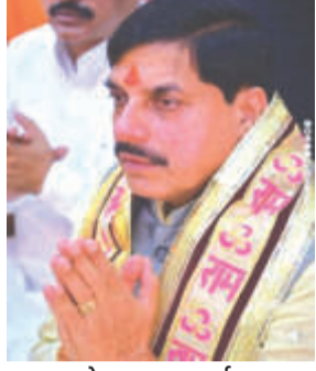
भोपाल

अंत्योदय का ध्येय, भारत के समग्र विकास के लिए संकल्पित 4,399 दिन...संपूर्ण भारत की आकांक्षाओं के प्रतीक, यशस्वी प्रधानमंत्री नरेन्द्र मोदी जी को स्वतंत्र भारत के इतिहास में सबसे अधिक समयावधि तक निर्वाचित प्रधानमंत्री के रूप में ऐतिहासिक नेतृत्व देने गौरव प्राप्त हुआ है। मध्य प्रदेश में इस अवसर पर प्रधानमंत्री नरेन्द्र मोदी जी की उपलब्धियों को आम जनता तक पहुंचाने के साथ-साथ उनकी लंबी उम्र के लिए धार्मिक कार्यक्रम आयोजित किए गए। इसी श्रृंखला में राजधानी के गुफा मंदिर में हनुमान चालीसा पाठ का आयोजन किया गया, जिसमें प्रदेश के यशस्वी मुख्यमंत्री डॉ. मोहन यादव तथा भारतीय जनता पार्टी के वरिष्ठ कार्यकर्ता, प्रजोधिकारी और विधायक गण मौजूद रहे। इस अवसर पर प्रदेश के गौरवशाली मुख्यमंत्री डॉ. मोहन यादव ने कहा कि- विश्व के सबसे विशाल लोकतंत्र में यह क्षण केवल राष्ट्र की आर्थिक प्रगति तक सीमित नहीं, बल्कि देश के आत्मविश्वास, आत्मनिर्भरता और