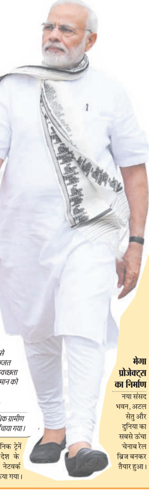
मेगा प्रोजेक्ट्स का निर्माण नया संसद भवन, अटल सेतु और दुनिया का सबसे ऊंचा चनाब रेल ब्रिज बनकर तैयार हुआ।

भोपाल ■ जगत दर्शन आज से लगभग डेढ़ दशक पहले की राजनीति का अगर अवलोकन करें, तो किसी ने सोचा भी नहीं होगा कि भारत में न केवल एक स्थिर सरकार बनेगी, बल्कि इतनी मजबूत सरकार आएगी, जिसके कारण भारत का गौरव और दबदबा पूरे विश्व में हो जाएगा। 2014 में लोकसभा चुनाव के परिणाम आने के बाद भारत ने प्रधानमंत्री के रूप में तब के गुजरात के मुख्यमंत्री नरेंद्र मोदी को चुना, तो एक आशा जरूर थी कि भारत अब