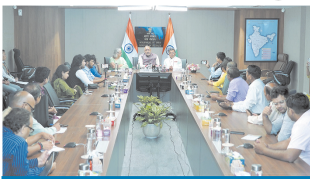
वस्त्र मिशन के तहत देश में अभिन्नव परियोजनाएं शुरू की

नई दिल्ली। एजेंसी केंद्रीय वस्त्र मंत्री गिरिराज सिंह ने गुरुवार को पिछले 12 वर्षों में वस्त्र मंत्रालय की उपलब्धियों पर प्रकाश डालते हुए कहा कि प्रधानमंत्री नरेन्द्र मोदी के दूरदर्शी नेतृत्व में वस्त्र और परिधान क्षेत्र में अगले 3 वर्षों में लगभग 2 करोड़ अतिरिक्त रोजगार सृजित करने की उम्मीद है।