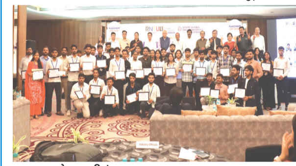
आरिधित प्रशिक्षण एवं मजबूत उद्योग-आकादमिक सहयोग का प्रमाण है। कार्यक्रम में प्रमुख अतिथियों के रूप में रवीन्द्रनाथ टैगोर विश्वविद्यालय (आरएनटीयू), भोपाल एवं स्कोप ग्लोबल रिक्रस यूनिवर्सिटी (एसजीएसयू), भोपाल द्वारा संयुक्त रूप से रैंडिसन होटल, गुलमोहर, भोपाल में भव्य प्लेसमेंट डे 2026 का आयोजन किया गया। इस अवसर पर दोनों विश्वविद्यालयों के 650 से अधिक चर्चविद्य विद्यार्थियों को देश की प्रतिष्ठित कंपनियों से प्राप्त नियुक्ति पत्र एवं प्रमाण-पत्र प्रदान कर सम्मानित किया गया।

शैक्षणिक सत्र 2025-26 दोनों अतिथि के रूप में रवीन्द्रनाथ टैगोर विश्वविद्यालय (आरएनटीयू), भोपाल एवं स्कोप ग्लोबल रिक्रस यूनिवर्सिटी (एसजीएसयू), भोपाल द्वारा संयुक्त रूप से रैंडिसन होटल, गुलमोहर, भोपाल में भव्य प्लेसमेंट डे 2026 का आयोजन किया गया। इस अवसर पर दोनों विश्वविद्यालयों के 650 से अधिक चर्चविद्य विद्यार्थियों को देश की प्रतिष्ठित कंपनियों से प्राप्त नियुक्ति पत्र एवं प्रमाण-पत्र प्रदान कर सम्मानित किया गया। शैक्षणिक सत्र 2025-26 दोनों अतिथि के रूप में रवीन्द्रनाथ टैगोर विश्वविद्यालय (आरएनटीयू), भोपाल एवं स्कोप ग्लोबल रिक्रस यूनिवर्सिटी (एसजीएसयू), भोपाल द्वारा संयुक्त रूप से रैंडिसन होटल, गुलमोहर, भोपाल में भव्य प्लेसमेंट डे 2026 का आयोजन किया गया। इस अवसर पर दोनों विश्वविद्यालयों के 650 से अधिक चर्चविद्य विद्यार्थियों को देश की प्रतिष्ठित कंपनियों से प्राप्त नियुक्ति पत्र एवं प्रमाण-पत्र प्रदान कर सम्मानित किया गया।