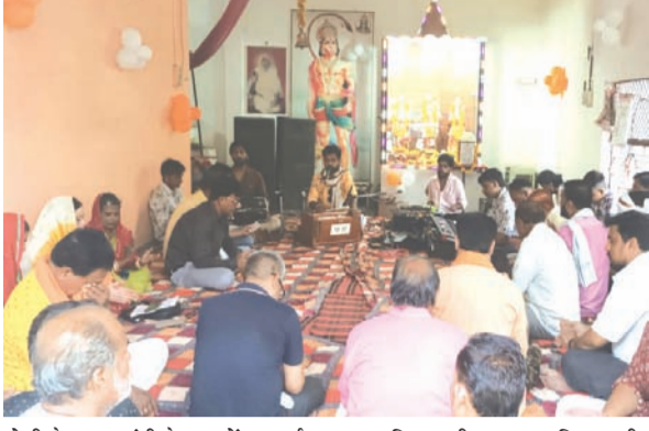
मोदी के प्रधानमंत्री के रूप में 12 वर्ष पूर्ण होने पर शुभकामनाएं दीं। भाजपाईयों ने बताया कि युवा कार्यकर्ताओं ने पूर्ण उत्साह के साथ

नर्मदा के प्रधानमंत्री पद पर सफलतापूर्वक 12 वर्ष पूर्ण होने पर प्रदेश भाजपा संगठन के निर्देश अनुसार बुधवार को शाम नगर के मुख्य बाजार स्थित काली मंदिर में सुंदरकांड पाठ का आयोजन किया गया। जिसमें भाजपा के वरिष्ठ नेताओं तथा कार्यकर्ताओं ने संस्वर पाठ का वाचन किया। वहीं आमंत्रित भजन मंडल के कलाकारों द्वारा भी भजन प्रस्तुत किये गए। इस धार्मिक कार्यक्रम में सोहागपुर शहरी व ग्रामीण क्षेत्र के सैकड़ों भाजपा नेताओं-कार्यकर्ताओं ने उपस्थिति दी। तथा सभी ने एक दूसरे को नर्मदा