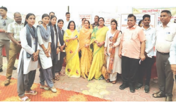
का अंदाजा इसी बात से लगाया जा सकता है कि इसमें पुणे (महाराष्ट्र) की 8 दिग्गज कंपनियों के साथ ही स्थानीय मोहासा औद्योगिक क्षेत्र, नर्मदापुरम, भोपाल, इंदौर, बुधनी, अब्दुल्लागंज और मंडीदीप की कुल 34 कंपनियों ने भाग लिया। रोजगार मेले में करीब 300 युवाओं ने

स्थानीय शासकीय गृहविज्ञान स्नातकोत्तर अग्रणी महाविद्यालय परिसर में जिला प्रशासन एवं जिला रोजगार कार्यालय द्वारा आयोजित 'युवा संगम' रोजगार एवं स्वरोजगार मेले का आयोजन अत्यंत सफल रहा। इस मेले का उद्देश्य जिले के शिक्षित बेरोजगार युवाओं को एक ही मंच पर निजी और सार्वजनिक क्षेत्र में रोजगार के अवसर प्रदान करना था। 34 प्रतिष्ठित कंपनियों ने किया चयन: मेले की व्यापकता