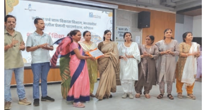
अजीम प्रेमजी फाउण्डेशन से जुड़े जानकार शामिल हुए। सेमिनार में 14 आंगनवाड़ी कार्यकर्ताओं की प्रस्तुतियां केंद्र में रहीं, जिनमें उन्होंने खेल, गतिविधियों और स्थानीय शिक्षण-संसाधनों के उपयोग से विकसित शिक्षण पद्धतियों को प्रस्तुत किया। इस सेमिनार का आयोजन फंडा परियोजना एवं अजीम प्रेमजी फाउण्डेशन के संयुक्त तत्वावधान में किया गया।

शाला पूर्व शिक्षा को बच्चों के लिए अधिक आनंददायक, प्रभावी और सीख-केंद्रित बनाने की दिशा में आंगनवाड़ी कार्यकर्ताओं द्वारा किए जा रहे नवाचारों और प्रयासों को साझा करने के लिए अजीम प्रेमजी यूनिवर्सिटी सभागार में ईसीई सेमिनार आयोजित किया गया। फंडा परियोजना के अंतर्गत आयोजित इस सेमिनार में आंगनवाड़ी कार्यकर्ताओं ने अपने केंद्रों पर किए गए प्रयोगों, बच्चों के साथ हुए सीखने के अनुभवों और स्थानीय संसाधनों के उपयोग से विकसित शिक्षण पद्धतियों को प्रस्तुत किया। इस सेमिनार का आयोजन फंडा परियोजना एवं अजीम प्रेमजी फाउण्डेशन के संयुक्त तत्वावधान में किया गया।