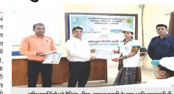
प्रशिक्षार्थियों को बैकिंग, बीमा, सफल उद्यमी के गुण आदि जानकारी दी